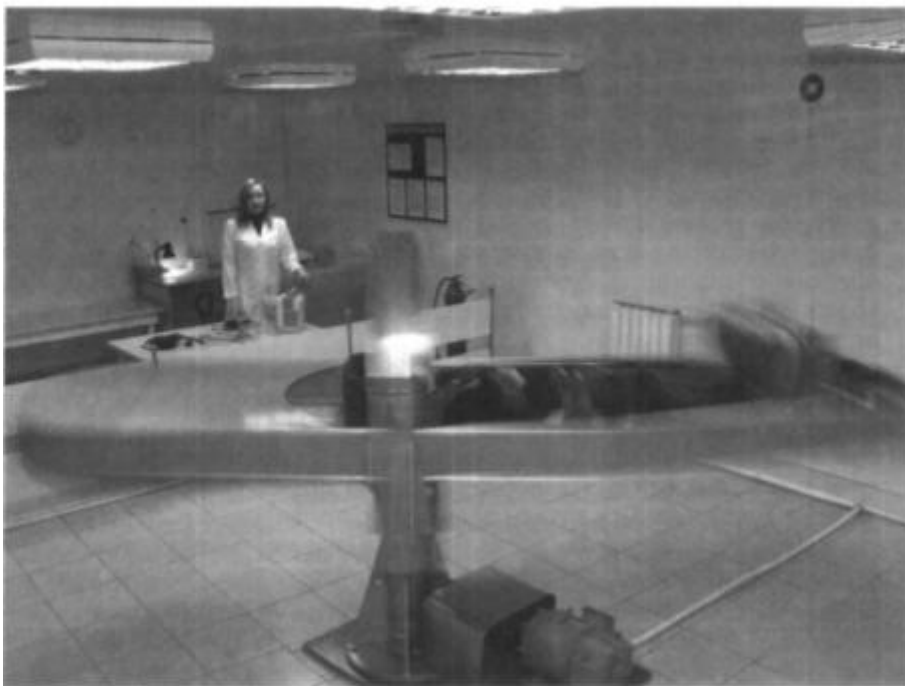
Рис. 5-108. Центрифуга в действии.

После окончания сеанса и полной остановки центрифуги пациент остаётся в положении лежа не менее 3-5 мин во избежание возможных проявлений поствращения шательного синдрома.