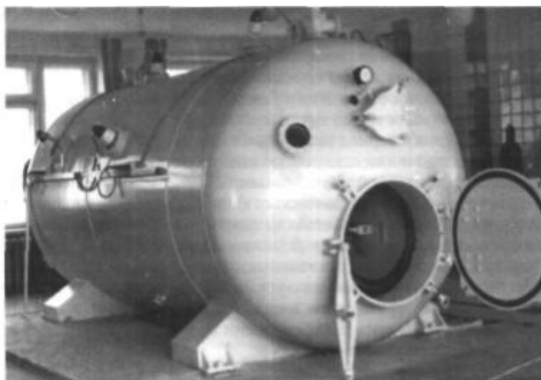
Рис. 5-104. Многоместная барокамера «Волга-МТ».